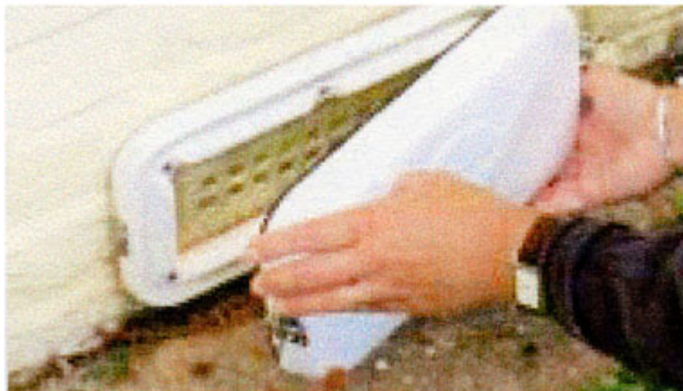
Couvercle pour bouche d'aération ou de ventilation